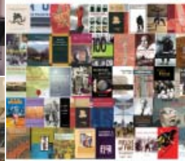
International Canadian Studies Titles / Titres offerts en français-anglais