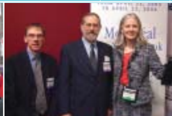
Books on Canada 2005 - Livres sur le Canada 2005