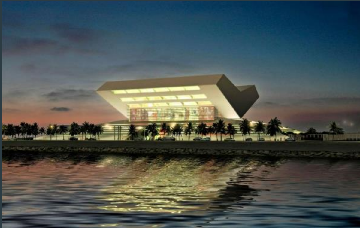
Bibliothèque Mohammed bin Rashid, Dubaï, EAU